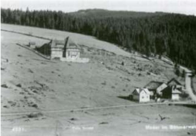
Die Klostermann-Hütte in Mader – ca. 1927