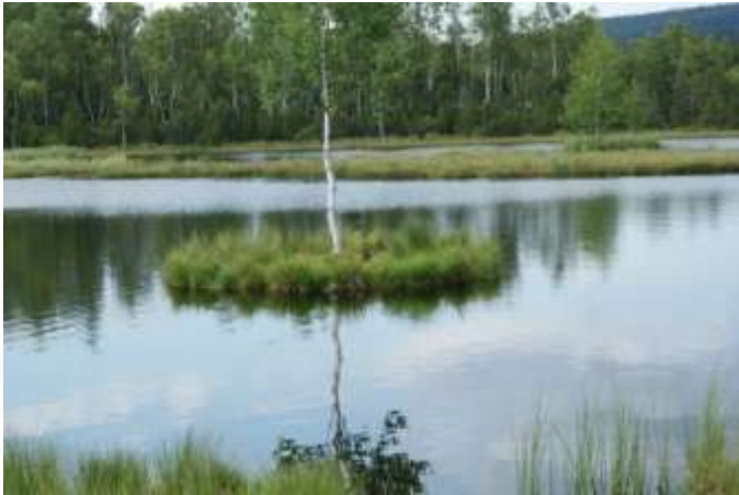
„Königs-Filz“ (Chalupská slat)